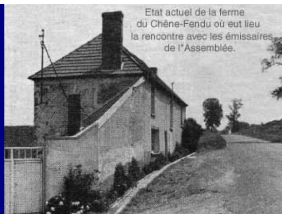
Etat actuel de la ferme du Chêne-Fendu où eut lieu la rencontre avec les émissaires de l'Assemblée.

paroles confuses jaillissent de l'intérieur. Marie-Antoinette et Madame Élisabeth paraissent en effet éplorées ; elles parlent avec précipitation. Pétion interrompt ce qu'il qualifie de caquetage pour lire le décret de l'Assemblée qui donne pleins pouvoirs aux commissaires et prévoit que le respect dû à la dignité royale doit être maintenu . Il grimpe sur le siège de la berline pour en faire une seconde lecture à la foule, qui fait soudain silence. Il précise à deux reprises que Dumas est chargé des escortes et qu'on doit lui obéir.