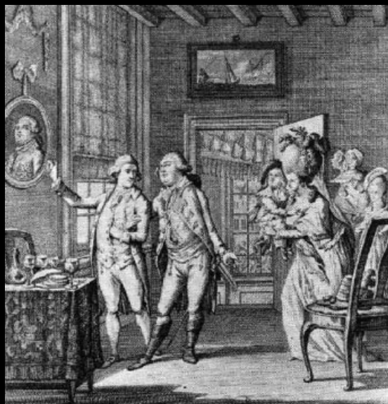
La nuit tragique de Varennes, vue par les Néerlandais

Certains municipaux indiquent au Roi un escalier dérobé et non gardé qui part de la chambre où dort le Dauphin : le Roi pourrait fuir et gagner à cheval l'armée de Bouillé. Mais il lui faudrait abandonner sa famille : Louis XVI refuse. Le jour commence à poindre quand il s'endort... Il compte sur l'arrivée des Rémois en se souvenant des acclamations du sacre et songe qu'il pourrait peut-être rester à Châlons. Il est 23h30, le 22 juin, quand le cortège arrive à Châlons. La famille royale, en route depuis quatorze longues heures, couverte de poussière, est exténuée. Madame Royale a peine à se tenir debout. Châlons est une ville d'opinion plutôt monarchiste et la municipalité a préparé un repas copieux et des logis. Il faut encore subir les harangues des municipaux. La famille peut alors se mettre à table. Il est 02h00 quand le Roi et les siens, qui ne se sont pas couchés depuis leur départ des Tuileries, peuvent enfin gagner leur lit.