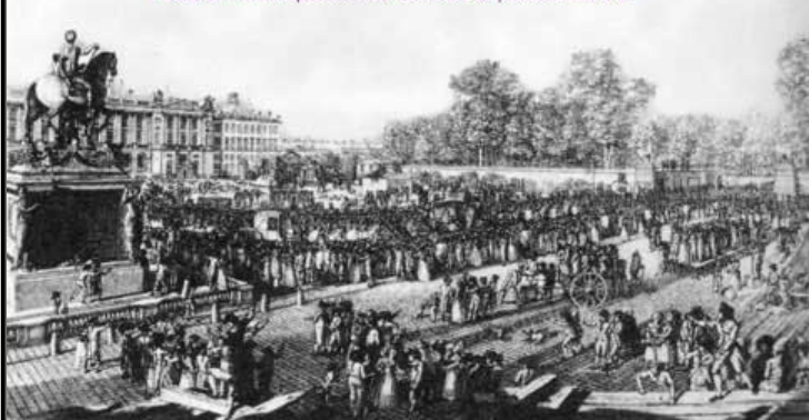
La berline des prisonniers traverse la place Louis XV.